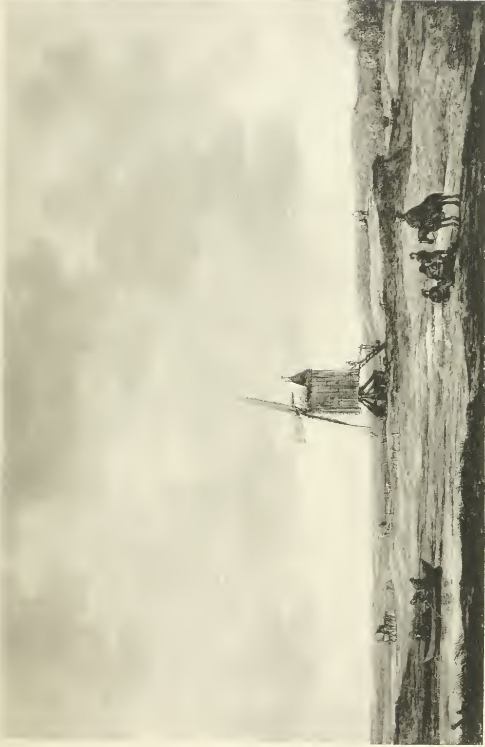
J. VAN GOYEN

TERCENTENAIRE DE REMBRANDT - EXPOSITION FREDERIK MULLER & CIE,